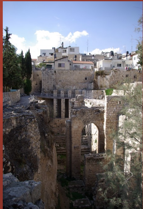
Piscine de Bethséda